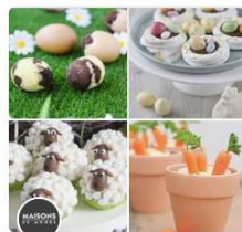
Nos recettes ♥ | Mais... Maisons du Monde • 192 épingles