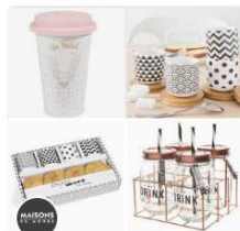
Modern Design Maisons du Monde • 489 épingles