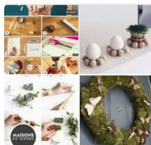
DIY Maisons du Monde • 218 épingles