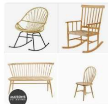
Scandinave Maisons du Monde • 117 épingles